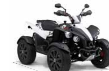
Gunner 550 4x2 LOF*