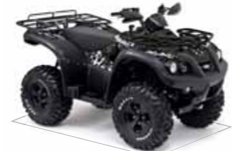
Blade 500 4x4 IRS LOF*