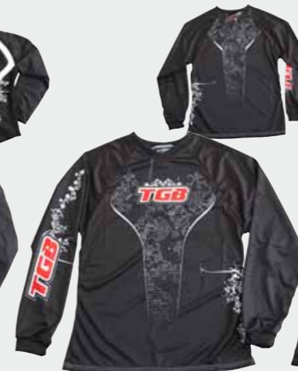
Trikot (Damen) M-XXL