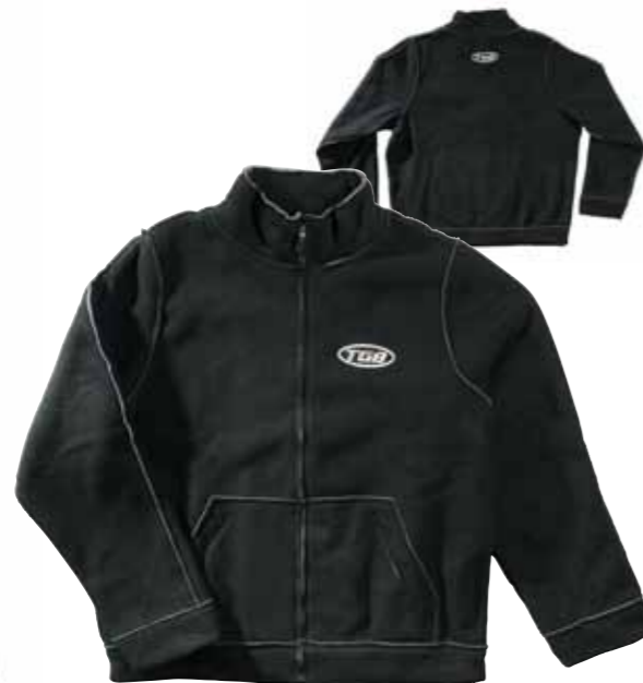
Fleece Jacke S - XXL