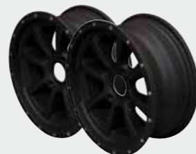
Aluminiumfelgen schwarz 14"