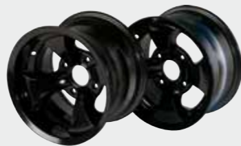
Aluminiumfelgen schwarz 12"