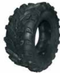
Geländereifen Innova 12"