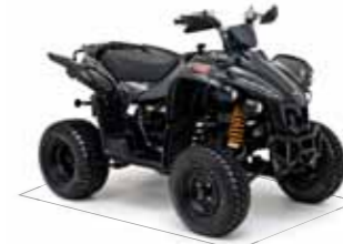
Target 325 4x2