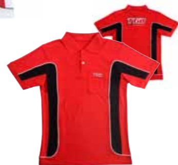
Polo Shirt Rot/Schwarz M-XXL