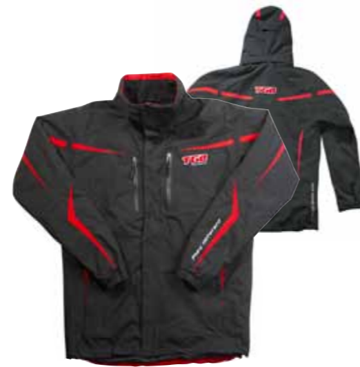
Windbreaker mit integrierter Kapuze M-XXL