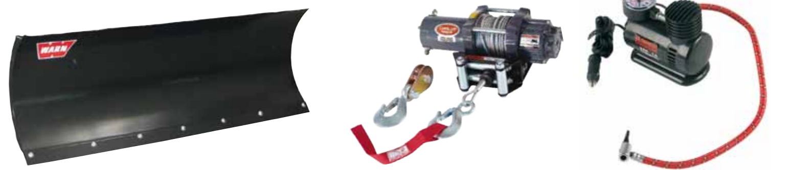
Schneeschild mit Front- oder Mittelaufnahme