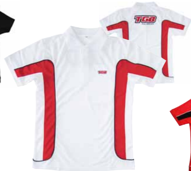
Polo Shirt Weiß/Rot M-XXL