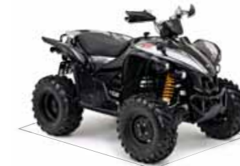
Target 500R 4x4 LOF*