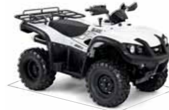
Blade 500R 4x4 LOF*