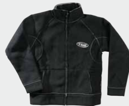
Fleece Jacke (Damen) S-XL