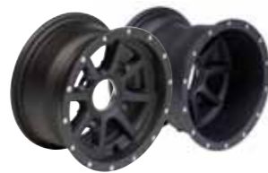
Aluminiumfelgen schwarz 10"