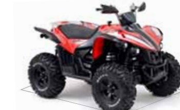
Target 550 4x4 IRS LOF*