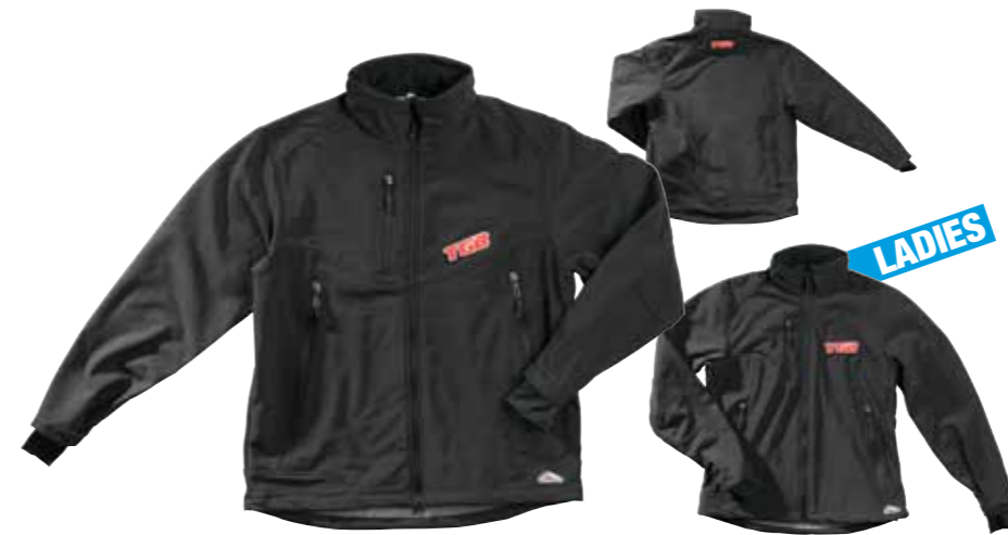
Softshell Jacke S-XXXL