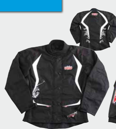
Jacke (Damen) M-XXL