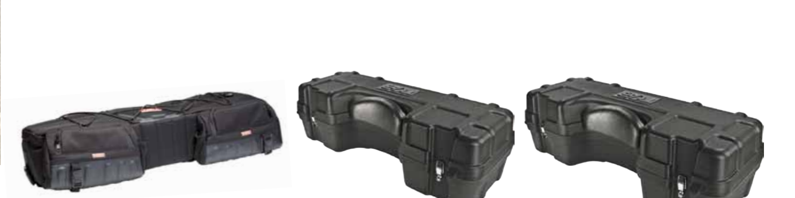
Soft Top Case