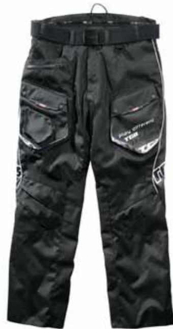
Hose L - XXXL (34-40)