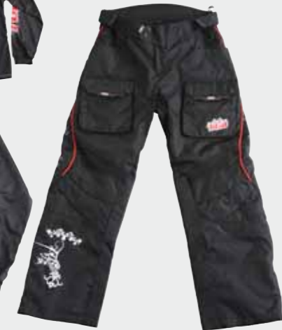
Hose (Damen) M-XXL (32-38)