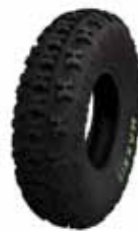
Geländereifen Maxxis Razr 10"