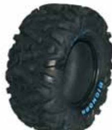
Geländereifen Maxxis Bighorn 14"