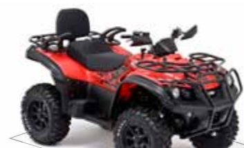
Blade 550 LT 4x4 IRS LOF*