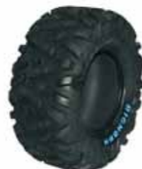
Geländereifen Maxxis Bighorn 12"