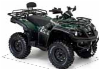
Blade 550 4x4 IRS LOF*