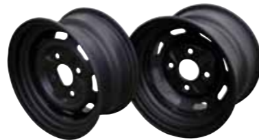
Stahlfelgen schwarz 12"