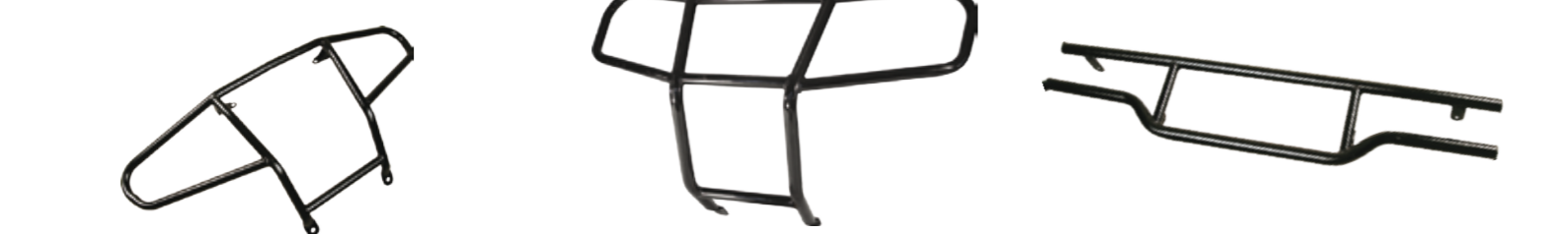
Rammschutz vorne Typ A Blade