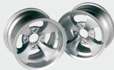
Aluminiumfelgen silber 12"