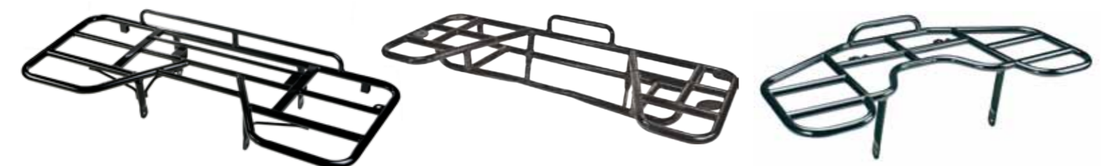
Gepäckträger hinten Blade