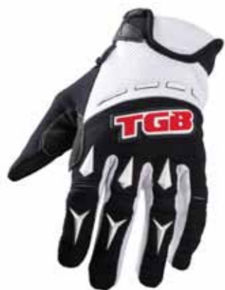
Enduro Handschuh 09-13