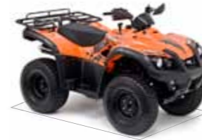
Blade 325 4x2