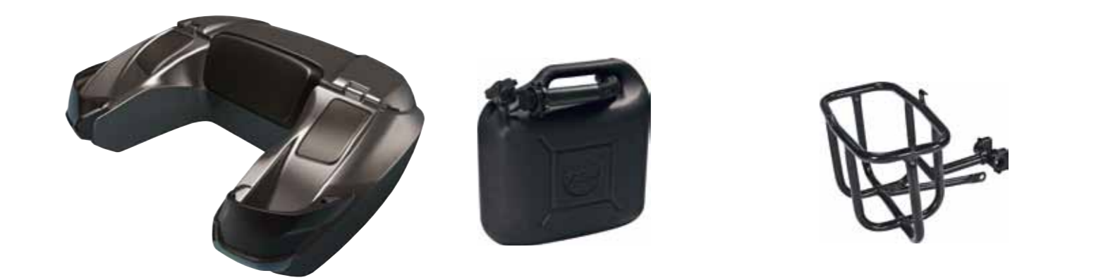
Top Case 135 Liter