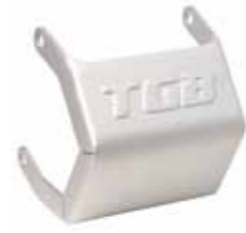
Aluminium Schutzblech Differential