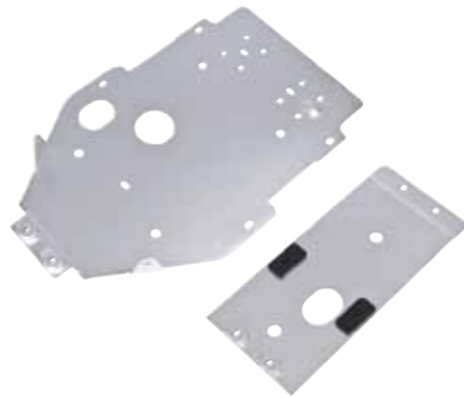
Aluminium Unterfahrerschutz Blade/Target